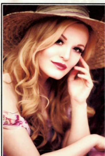
MELANIE DIETZE photoart